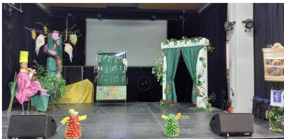
Décor du spectacle « la flûte enchantée » du conservatoire d'Antony en 2023